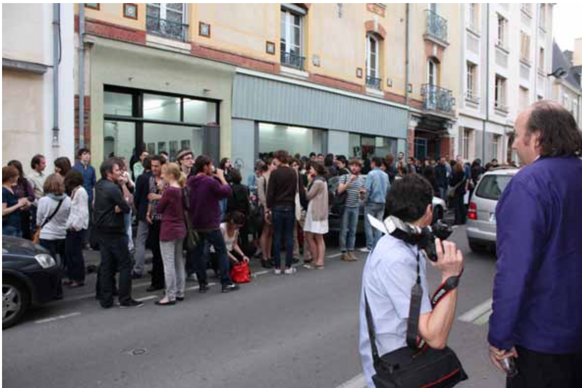
DMA Galerie, exposition Rennes 1981, vue extérieure

DMA Galerie présente chaque année des productions inédites de designers et artistes issus de street art et du graffiti dans le cadre de sa programmation d'expositions.