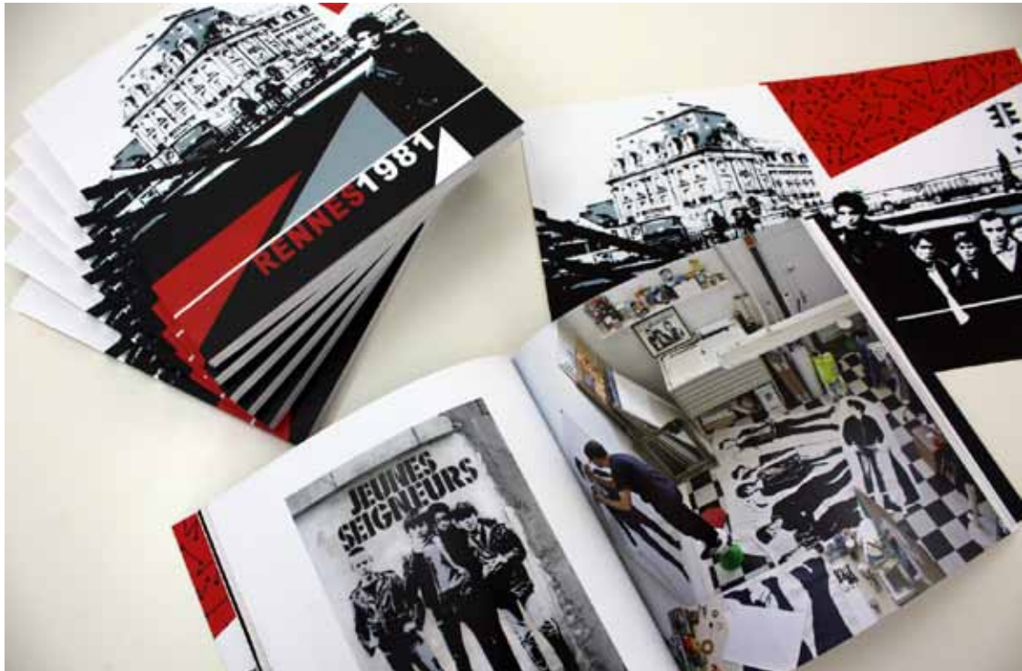
catalogue «Rennes 1981», édition 500 ex.