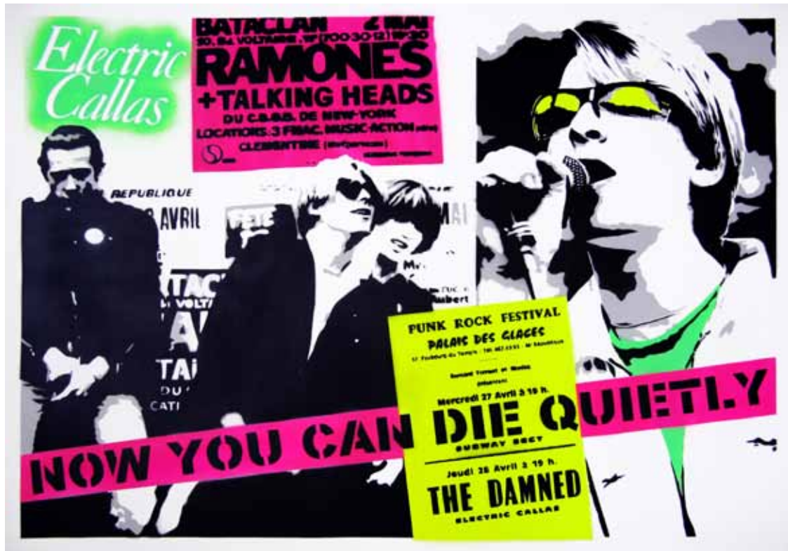
pochoir 70x100cm «Now you can die quietly»