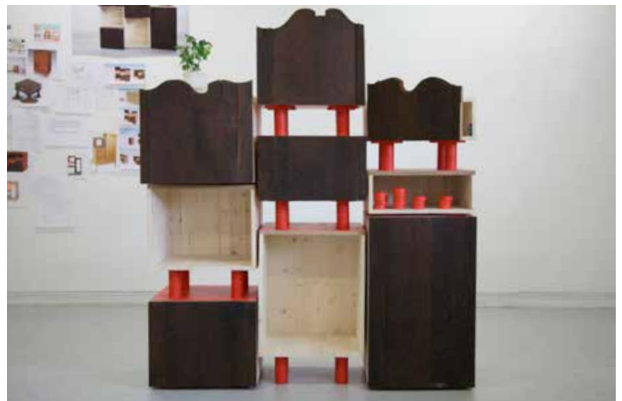
Vues de l'accrochage à l'occasion du diplôme de 5ème année (DNSEP) à l'École des Beaux Arts de Rennes (EESAB), 2012.