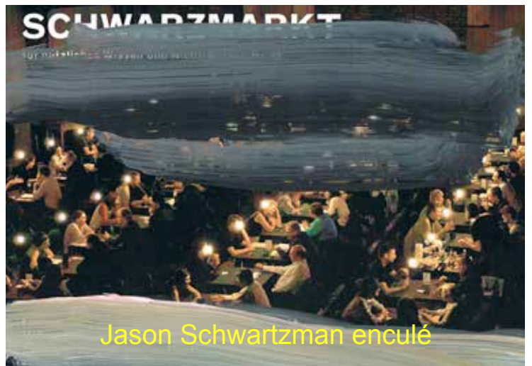
Jason Schwartzman enculé