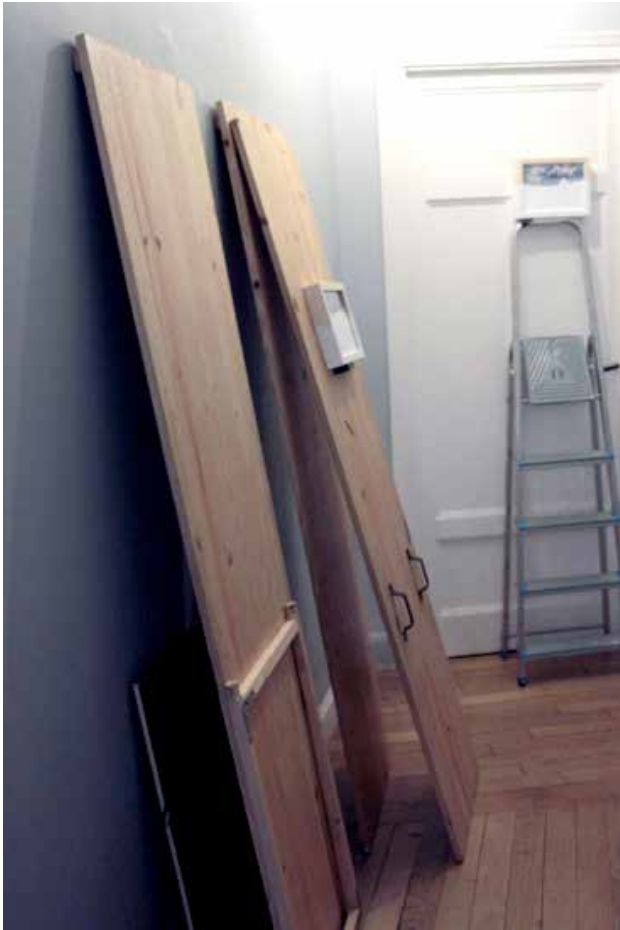
Sans titre , exposition du collectif Vlan «Cataclysme 1/2» en appartement, Rennes, 2012.